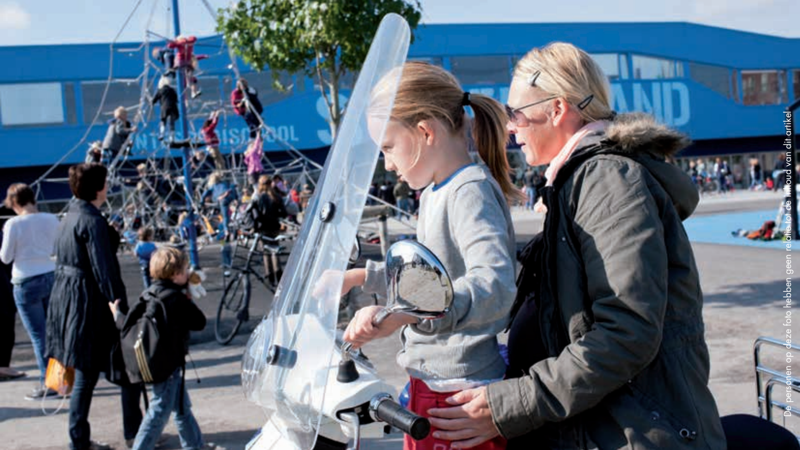
De personen op deze foto hebben geen relatie tot de inhoud van dit artikel